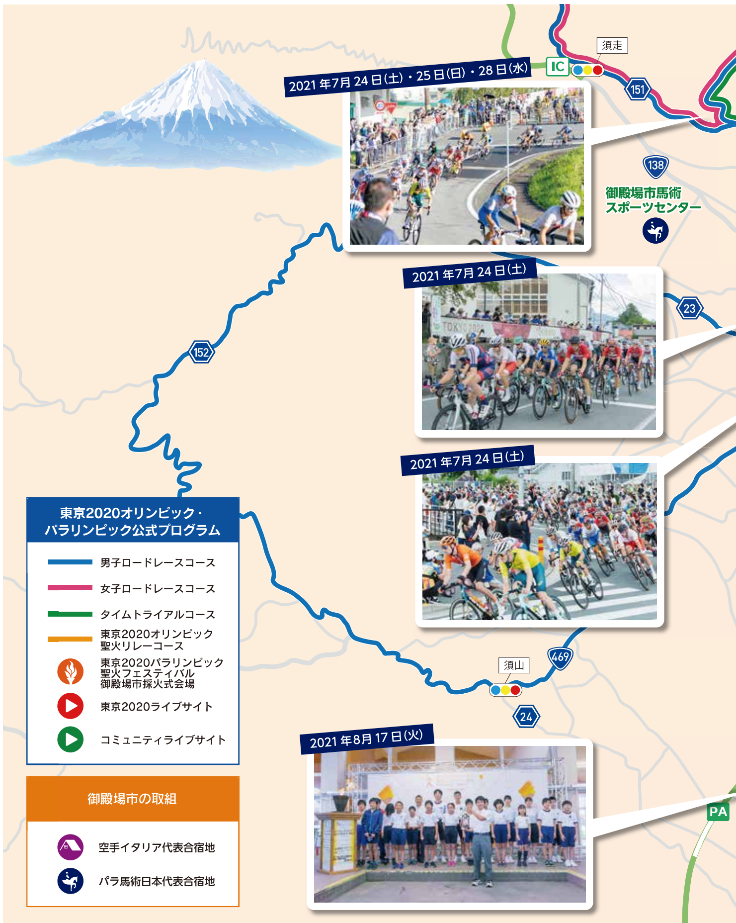
2021年7月24日(土)・25日(日)・28日(水)